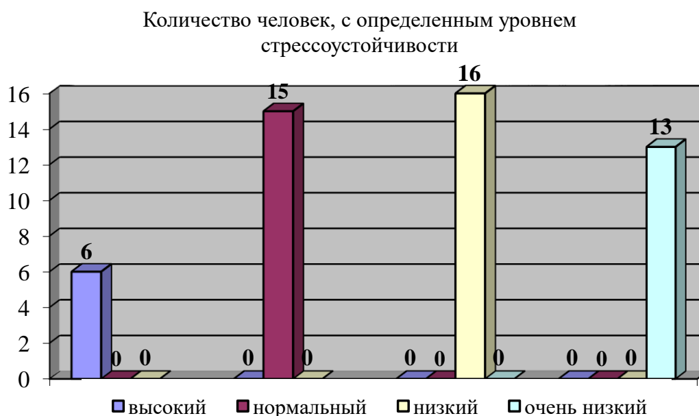
Рис. 3. Результаты исследования определения уровней стрессоустойчивости педагогов

У 15 (30 %) воспитательниц нормальный уровень стресса, который соответствует в меру напряженной жизни активного человека, 16 (32 %) человек имеют низкий уровень стрессоустойчивости, это говорит о том, что стрессовые ситуации оказывают немаловажное влияние на жизнь этих людей, и они им не сопротивляются. И 13 педагогов (26 %) имеют очень низкий уровень стрессоустойчивости, они наиболее уязвимы к стрессам, чем все остальные. В этом случае педагогом необходимо серьезно задуматься о своей жизни – не пора ли ее изменить и подумать о своем здоровье. Количественные результаты исследования по выборке в целом отражены в гистограмме (рис. 3).