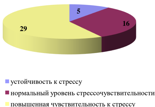
Рис. 4. Результаты определения уровня стрессочувствительности педагогов

Представленность испытуемых с разным уровнем стрессочувствительности в группах педагогов с высоким и низким уровнем профессиональной успешности следующая (табл. 3).