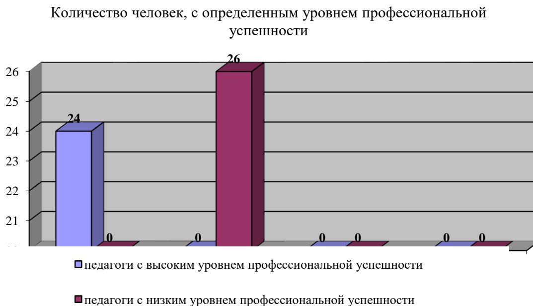
Рис. 1. Разделение педагогов на группы по уровням профессиональной успешности

Таким образом, у нас получилось две выборки: педагоги с высокой (56 % – 26 человек) и низкой (52 % – 24 человека) профессиональной успешностью. Данные результаты представлены в гистограмме (рис. 1).